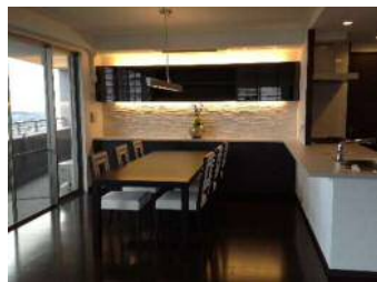
バルコニーからの朝日